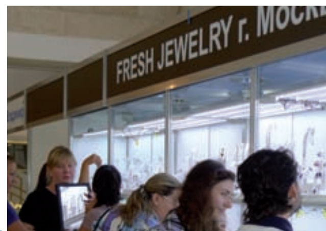
Благодаря прекрасному выбору украшений стенд Fresh Jewellery пользовался особой популярностью.

Август – пик туристического сезона в самом посещаемом городе Золотого кольца, и с будущего года ювелирная выставка включена в схему туристических маршрутов. С другой стороны, первый опыт показал, что следует более внимательно отнестись к выбору более «проходной» площадки и, возможно, более удобных сроков. ■