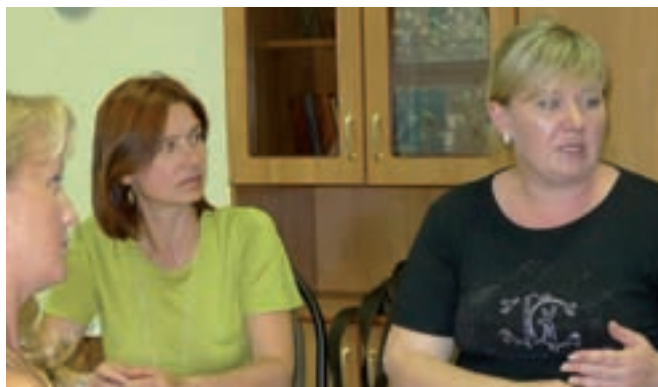
Активная позиция ювелиров по вопросу о Росдрагконтроле заставила власти поменять акцент в сторону содействия развитию отечественного производства.

В первый день выставку посетили директора местных ювелирных магазинов, которые оценили возможность ознакомиться с новинками, подготовленными к главной сентябрьской выставке JUNWEX-Москва.